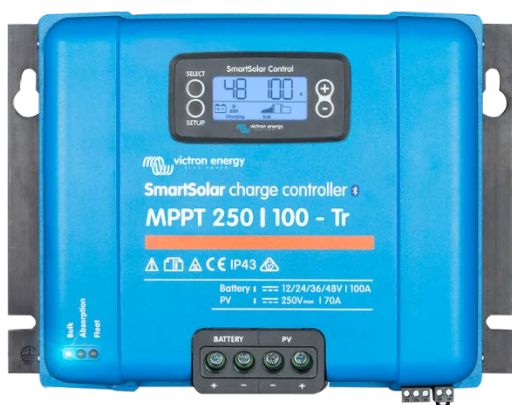
Controlador de carga solar MPPT 250/100-Tr Con dispositivo conectable