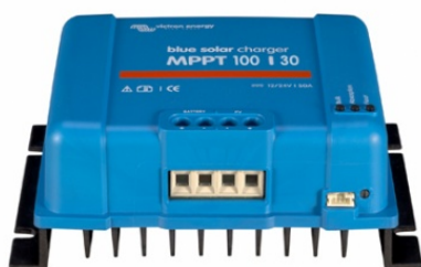
Controlador de carga solar MPPT 100/30